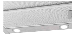
Beleuchtung Helle LED Beleuchtung